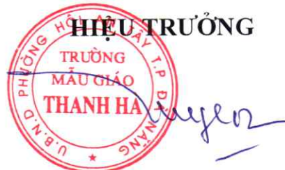
Đỗ Nữ Trâm Uyên